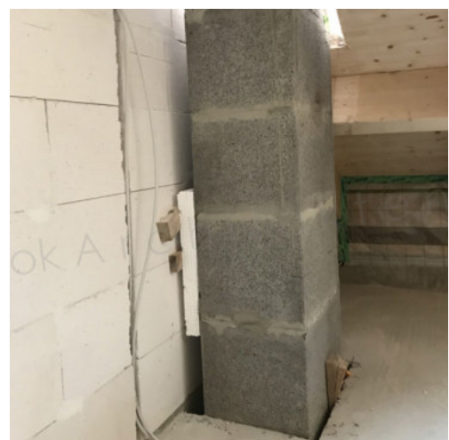
48: Aufmauern des Schornsteins