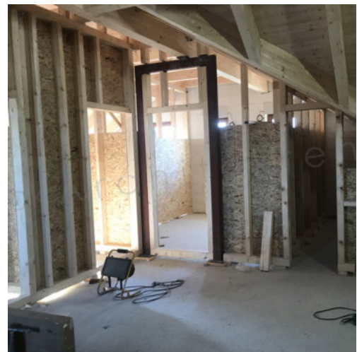
40: Beplanken der Holz-IW mit OSB-Platten