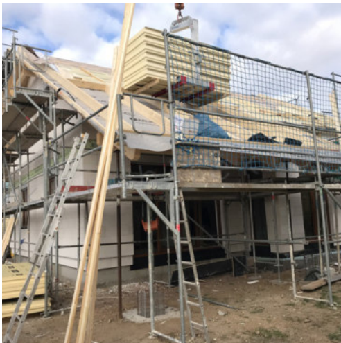
35: Verlegen der Aufsparrendämmung