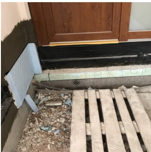
47: Dämmen des Sockelbereiches