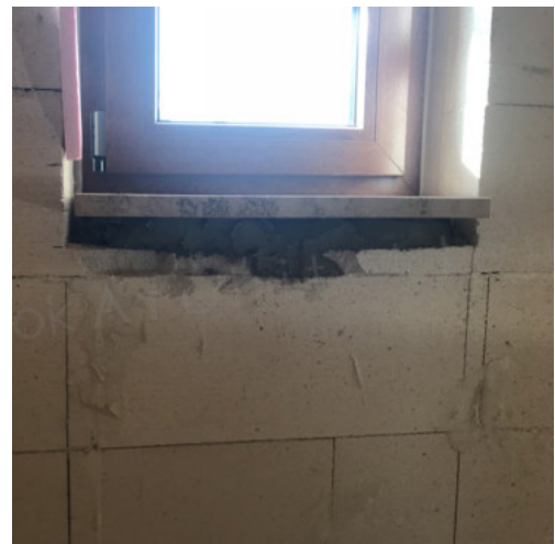
42: Einsetzen der Innenfensterbänke