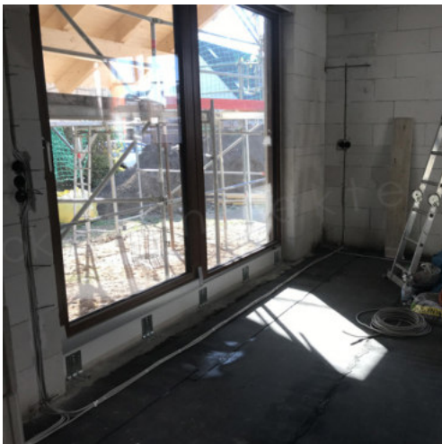
45: Verlegen der ELT-Leitungen; Abdichten BP