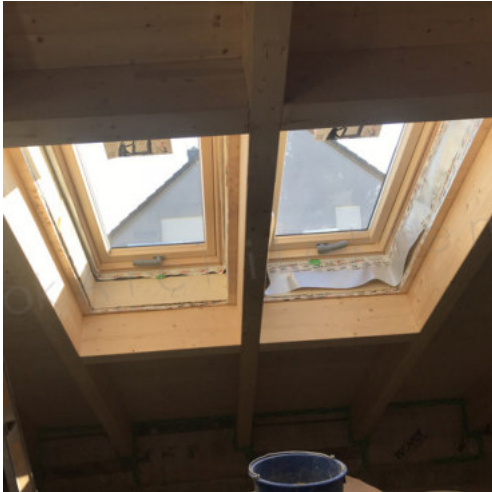
43: Einsetzen der Dachflächenfenster