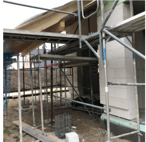
32: Bewehren & Betonieren der Einzelfundamente