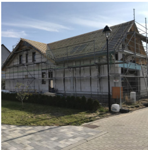
39: Fertigstellen der Dachlattung