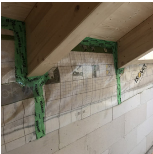
41: Abdichten der Übergänge Sparren-Drempel