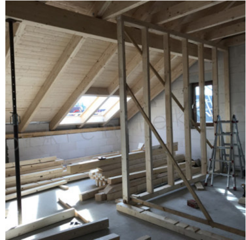
38: Aufbau der Holzständerwände DG