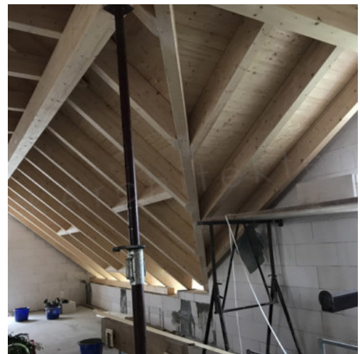
34: Fertigstellen der Dachschalung