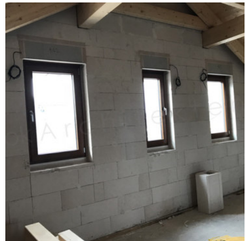
36: Einbau der Fenster mit elekt. Rollladen