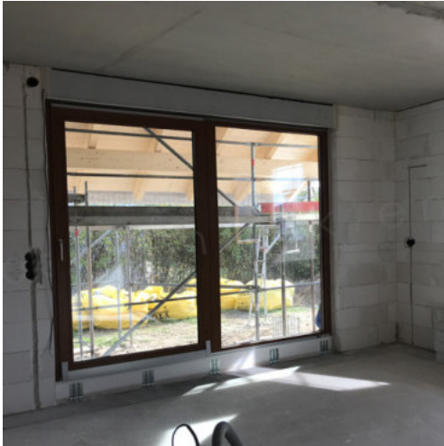
37: Schlenzarbeiten EG