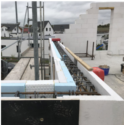
27 Bewehren der Drempel