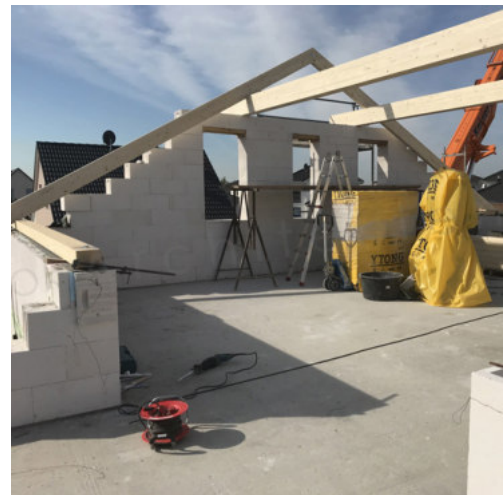
28: Beginn Setzen des Dachstuhl