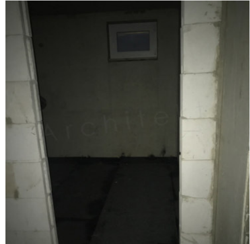
44: Abdichten der Bodenplatte KG