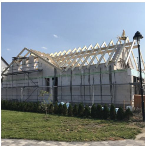
29: Richtfest Ansicht Nord