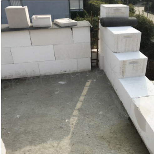
25: Beginn Mauerarbeiten AW OG