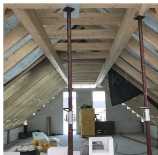
30: Aufbringen der Dachabdichtung