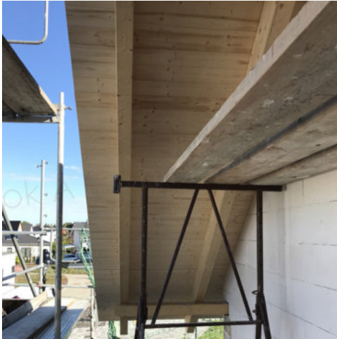
31: Anbringen der fl.- deckenden Dachschalung