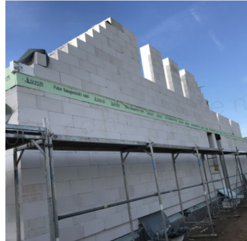
26: Mauerarbeiten Giebel & Drempel